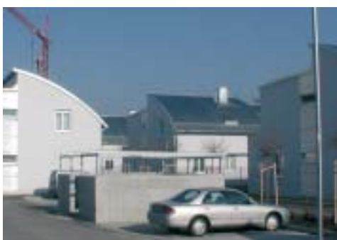
„Kleinvolumige“ Wohnhäuser in der Waldmüllerstraße

Sichtbarer Ausdruck dafür ist etwa die Errichtung der „kleinvolumigen“ Wohnhäuser in der Waldmüllerstrasse.