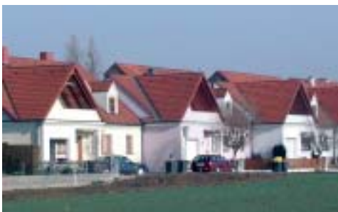
Verdichteter Flachbau in der Unteren Lochaustraße