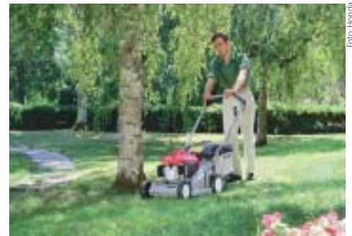
„Englischer Rasen“ – etwas pflegeintensiver

Ich halte es eher natürlicher und genieße die Artenvielfalt der Wiesenblumen in unserem Garten ebenso wie einen gepflegten Teil für Gäste und als Liegeplatz.