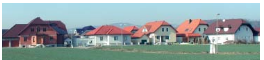
Einfamilienhaussiedlung in den Strauß-Beethoven-Straßen