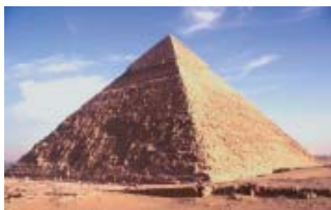
Die Cheopspyramide, ein Weltwunder

Gerade jüngste Forschungsprojekte und deren weltweite mediale Aufbereitung haben dazu beigetragen, dass die Pyramiden Ägyptens wieder verstärkt ins Bewusstsein der Allgemeinheit Eingang gefunden haben.