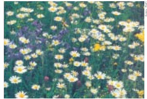
Artenvielfalt einer natürlichen Blumenwiese

Wer lieber „Natur im Garten“ bevorzugt, erspart sich viel Arbeit und Geld. Man muss sich entscheiden, ob man einen Teil seines Gartens als Blumenwiese, ohne Vertikutieren und Düngen natürlich belässt, oder die gesamte Fläche als „englischen Rasen“ gestaltet.