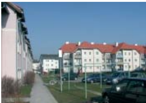
Jüngerer großvolumiger Wohnbau in der Rohrerstraße

Und man hat in Loosdorf auch erkannt, dass jedes Programm, so erfolgreich es auch ist, ständig den aktuellen Erfordernissen anzupassen ist. Auch das des „sozialen Wohnbaus“.