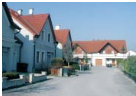
Verdichteter Wohnbau in den Hofer-Scheffäck-Straßen

kannt, dass Menschen immer älter werden und analog dazu immer öfter Betreuung für diese Bevölkerungsgruppe notwendig wird. Dieser Entwicklung kann sich auch der soziale Wohnbau nicht verschließen. So wird derzeit daran gearbeitet, am „alten Sportplatz“ unter anderem ein Wohnhaus mit etwa 12 Wohnungen zu errichten, das sogenannte „betreutes Wohnen“ ermöglicht. Eine Wohnform, die eine intensive Betreuung älterer Menschen in speziell für diese Altersgruppe gestalteten Wohnungen anbietet, gepaart mit einem gut funktionierenden Versorgungssystem sozialer Hilfe und Betreuung, Essen auf Rädern usw. Durch die immer besser ausgebaute ärztliche Versorgung wird es demnach in Zukunft für ältere Menschen leichter sein, ihren Lebensabend in unserer Gemeinde zu verbringen.