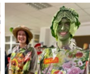
Beim Maskenball des Musikvereins überzeugten die Gäste unter dem Motto „Die 4 Elemente: Erde-Wasser-Feuer-Luft“ mit sehr kreativen Masken. Für tolle Stimmung auf der Tanzfläche sorgte wieder die Top-Band „SOUNDSTURM“.