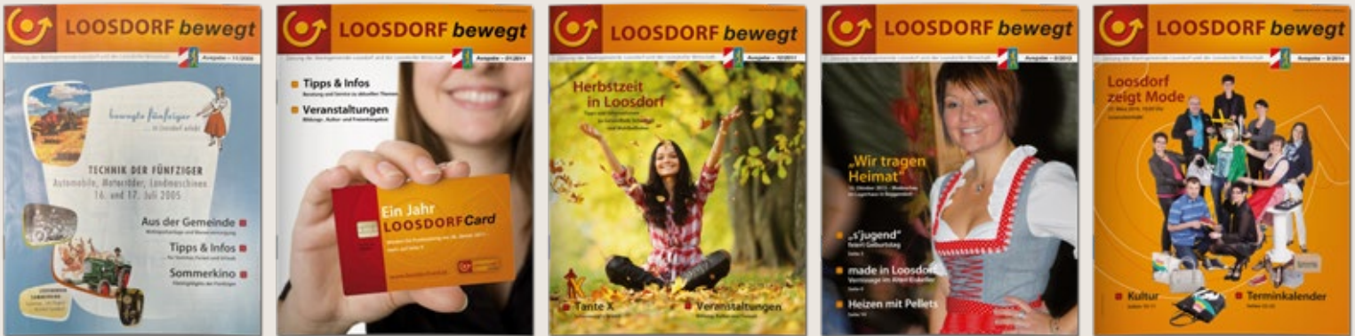
Fürs Zurückblättern in der „Loosdorf bewegt“-Geschichte (bis 2015) gibt's das digitale Zeitungsarchiv: www.loosdorf.at/gemeinde/aktuelles/loosdorf-bewegt

Verantwortliche Ansprechpersonen wurden seitens der Wirtschaft und der Gemeinde benannt, um die Inhalte und Anzeigen zu koordinieren.