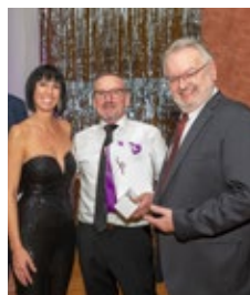
Die Ball-Saison wurde mit dem Gemeindeball „Loosdorf tanzt“ durch Mitglieder des Caritas-Treffpunkts und der Volkstanzgruppe eröffnet. Die Gäste konnten beim Show-Casino ihr Glück versuchen und tolle Tombola-Preise gewinnen.