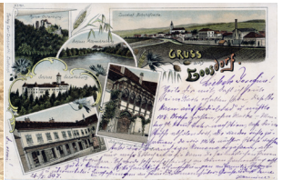
© Topothek Schallaburg - ID 0420395 Gruß aus Loosdorf

Allein das Lesen ist schon schwierig, schreiben muss man es nicht können. Eine alte Schrift lesen zu lernen bedeutet einerseits, den Duktus, den Schriftzug zu erfassen, vor allem aber, das Geschriebene zu verstehen. Man hat nämlich bis ins 20. Jahrhundert so geschrieben wie man es gehört hat, man hielt sich nicht an Grammatik und Rechtschreibung. Daher braucht man zum Lesen auch etwas Phantasie und ein „Hineindenken“ in den Text. Man tut sich viel leichter, wenn man weiß worum es in dem Schriftstück geht.