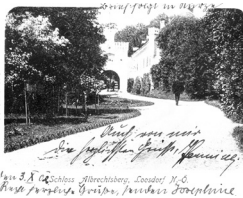
© Topothek Schallaburg - ID 1387436 Gruß aus Albrechtsberg